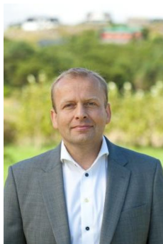
Kaj Leo Holm Johannesen Formaður í Sambandsflokkinum