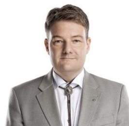
Magni Laksáfoss Næstformaður

Framløga á tíðindafundi 28. november 2016 á Gamla Apoteki